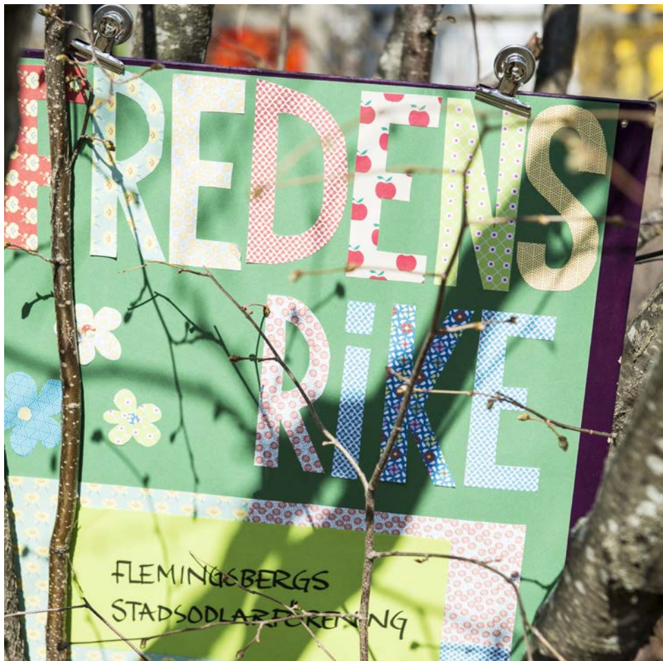
Fredens rike är namnet på Flemingsbergs stadsodlarförening, en ideell förening som arbetar för "en gemensam trädgård i Flemingsberg": "Vi vill skapa en trygg, färgglad och glad plats för alla som vill vara med!"

utvecklingen från nu och en bra bit in i oktober – så länge varar odlingssäsongen.